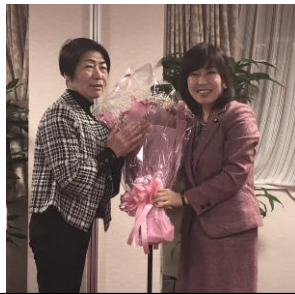
澤井京都府看護連盟会長より花束贈呈