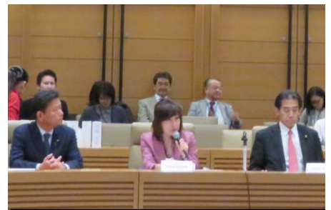
平和な社会で、全ての子どもに教育と健康を