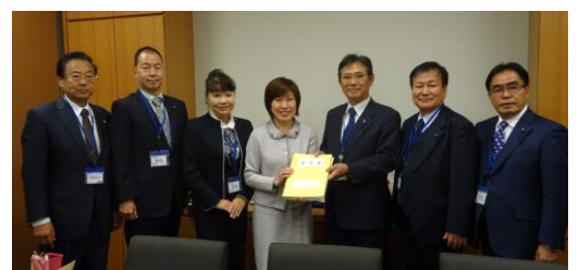
京都府議会議員の皆様と